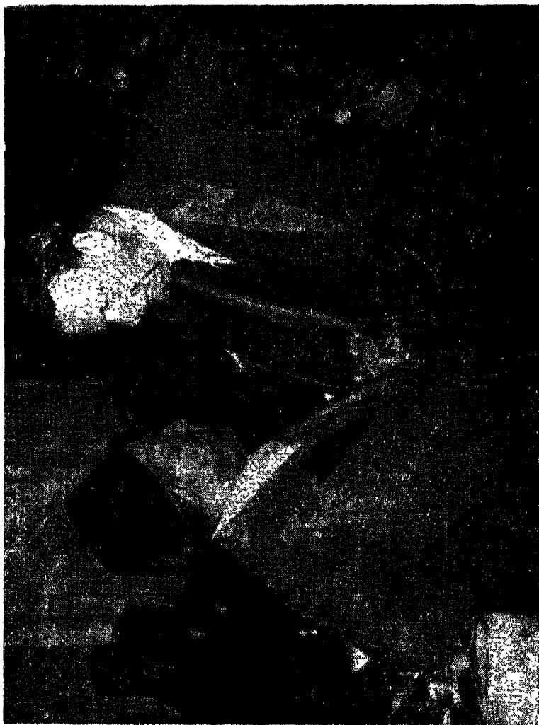
التعاضد باشا والسفير البريطاني